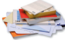
Tous les autres papiers