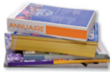
Catalogues, annuaires, livres