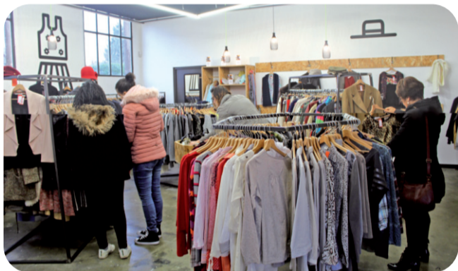
Boutique LA FRIP, rue Eisenhower à Dole.

En 2019, 105 conteneurs ont permis de collecter 493 tonnes de textile. C'est 16 tonnes de plus que l'année précédente ! Merci à vous !