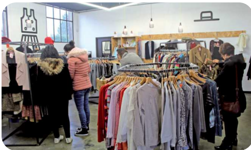
Boutique LA FRIP, rue Eisenhower à Dole.

Des conteneurs supplémentaires ont été installés en 2020, principalement sur la commune de Dole.