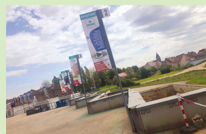
Vu sur la déchèterie de Dampierre